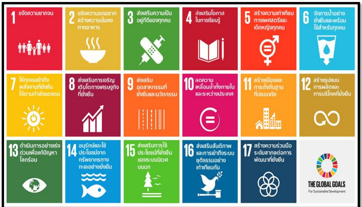
ภาพที่ ๒ เป้าหมายการพัฒนาที่ยั่งยืน (Sustainable Development Goals : SDGs)

๑๗.๑๙ ต่อยอดจากข้อริเริ่มที่มีอยู่แล้วในการพัฒนาการตรวจวัดความก้าวหน้าของการพัฒนาที่ยั่งยืนที่มีผลต่อผลิตภัณฑ์มวลรวมภายในประเทศ และสนับสนุนการสร้างขีดความสามารถด้านสถิติในประเทศกำลังพัฒนา ภายในปี ๒๕๗๓