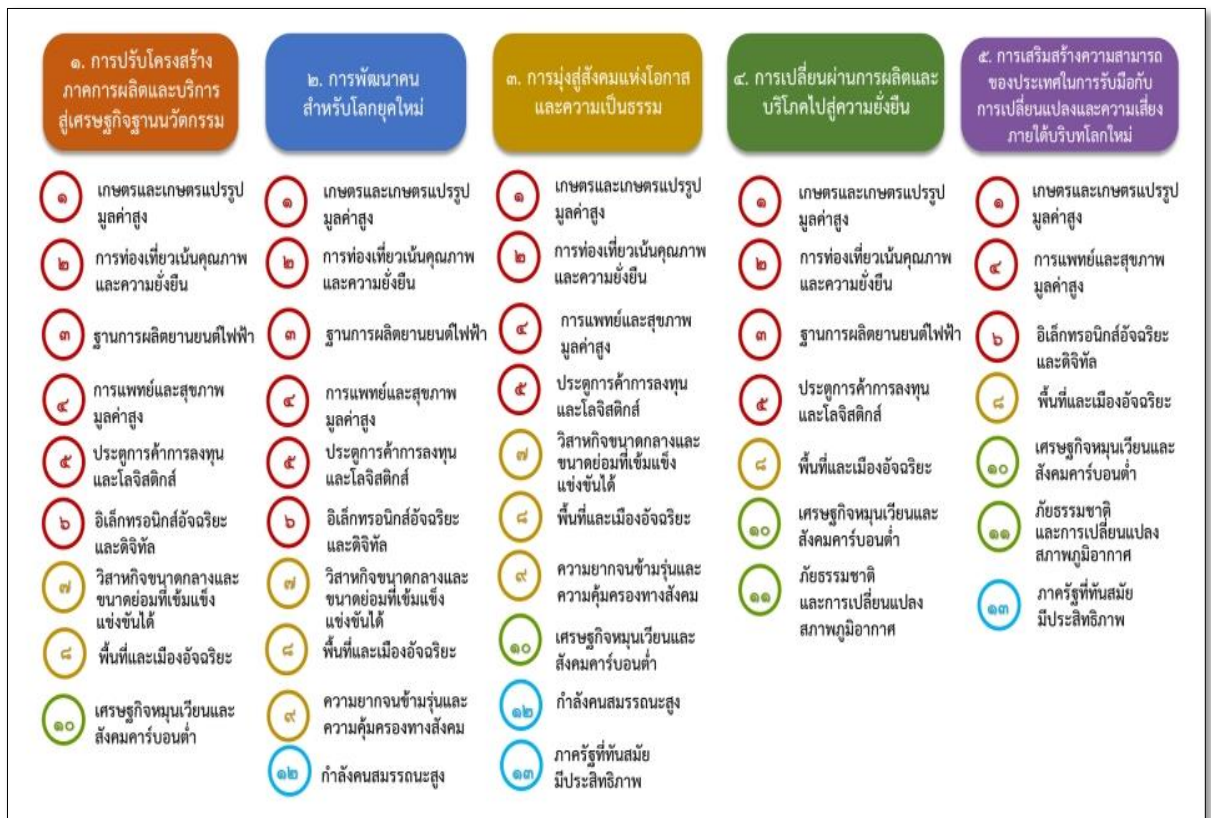
แผนภาพที่ ๑ ความเชื่อมโยงระหว่างหมวดหมายการพัฒนา กับเป้าหมายหลัก

ความเชื่อมโยงระหว่างหมวดหมายการพัฒนา กับเป้าหมายหลักแสดงไว้ในแผนภาพที่ ๑ โดยหมวดหมายการพัฒนาที่กำหนดขึ้นเป็นประเด็นที่มีลักษณะเชิงบูรณาการที่ครอบคลุมการพัฒนาตั้งแต่ในระดับต้นน้ำจนถึงปลายน้ำ และสามารถนำไปสู่ผลพัฒนาทั้งในมิติเศรษฐกิจ สังคม ทรัพยากรธรรมชาติและสิ่งแวดล้อมไปพร้อม ๆ กัน ทำให้หมวดหมายแต่ละประการสามารถสนับสนุนเป้าหมายหลักได้มากกว่าหนึ่งข้อ นอกจากนี้การพัฒนาภายใต้แต่ละหมวดหมายไม่ได้แยกขาดจากกัน แต่มีการสนับสนุนหรือเอื้อประโยชน์ซึ่งกันและกัน